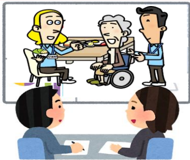
「介護の仕事」説明会会場